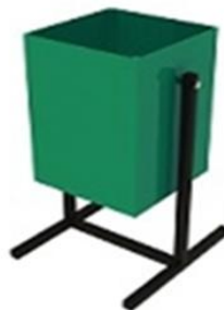
Рисунок 1 - Внешний вид изделия

Внешний вид изделия представлен на рисунке 1.